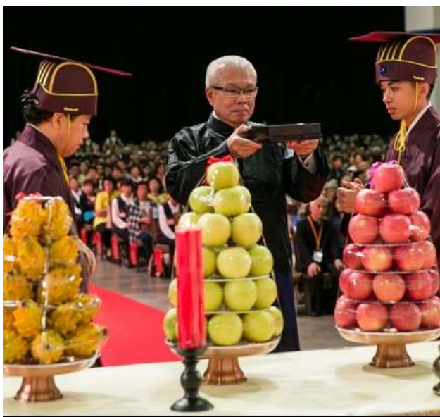
嘗畢，雙手捧盤，胸前稍頓。