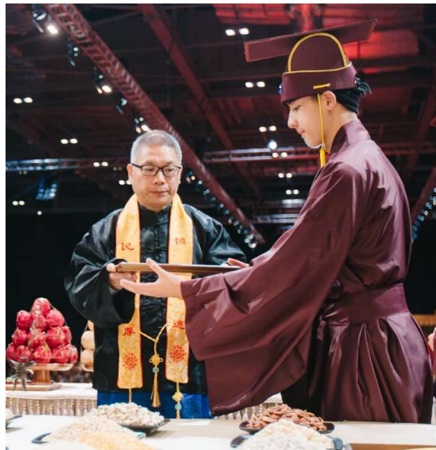
禮畢，胸前稍頓，左禮生接回。