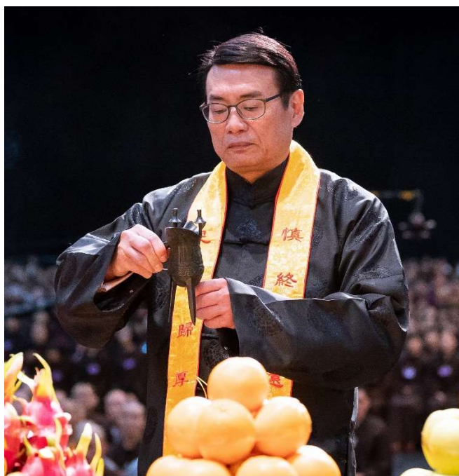
接爵：右手握爵耳，左手持爵腳。