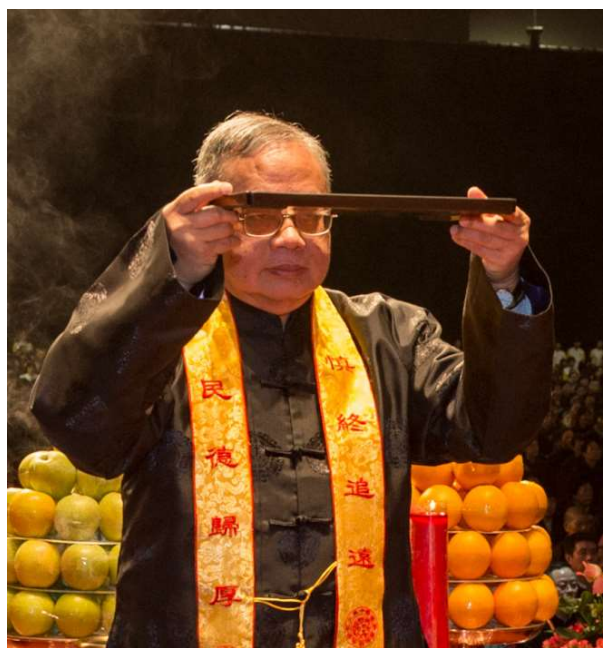
一舉齊眉，行獻帛禮。