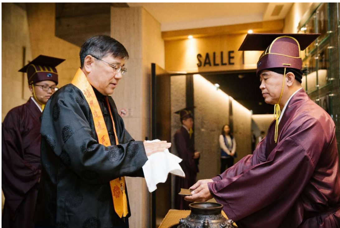
洗畢，手擦乾再就位。